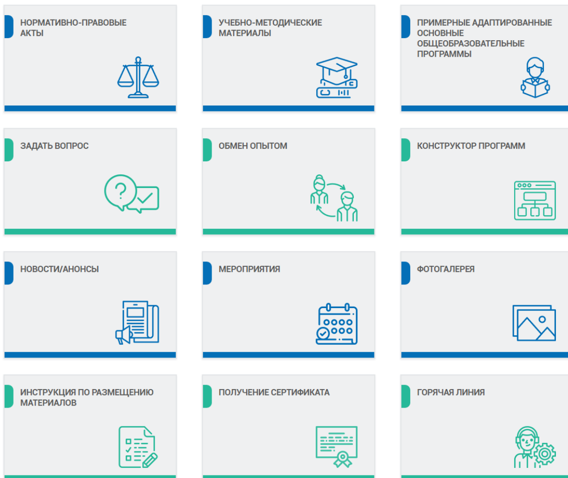
Рисунок 1 – Главная страница интернет-ресурса